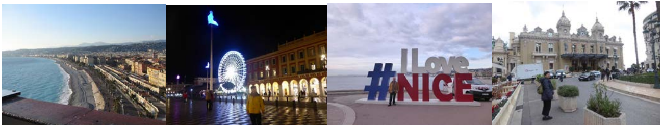
ブロムナード 怨嗟忘れる 絶景かな