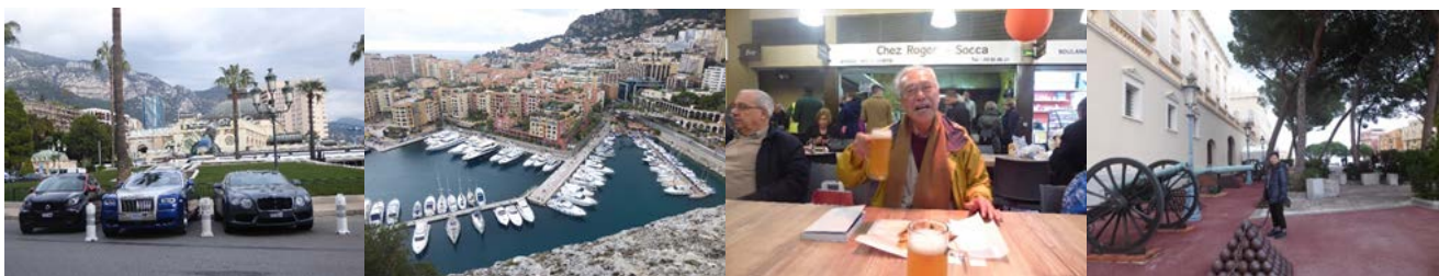
カジノ前名前も知らぬ高級車 (モナコ・モンテカルロ地区)

一攫千金、傲慢金満家の集まるリゾート地、どこか張り子のバーチャル・ワールドに迷い込んだ気がする。豪華な館を構え、一流品のガゼットに囲まれ、ひねもす大金を振りかざし優雅に過ごす輩の巣窟、その右代表がコートダジュールのモナコであろう。ニースからマントンにかけて一帯は平地が少なく、海沿いの急斜面にへばり付く様に瀟洒な邸宅が建つ。海の眺望もよく気候も温暖だ。きっと理想の棲み処に違いなからう。だが待てよ、日常の生活はどうか、一歩家から出れば上り下り、狭い街路に車の駐車も儘ならない。年老いたら買物にも行けまい。よしんばお手伝いさんを雇って身の回りの世話をしつて貰うにしても、一日中崖っ淵の家中に引き籠っていても精神的にも肉体的にも退化するだけだ。健全な庶民には住みにくい場所である。モナコの富豪ならいざ知らず、一般人は旧市街のゲットーに慎ましく暮らす。そんなコートダジュールのリゾート地を求めて、セレブ欲の金持ちが大勢やって来るのか、ニースの不動産屋は繁盛し現地建設ラッシュは続くようだ。フランスはおろか米露をはじめ世界中の金持ちが別荘を構える。近代以降ここに住みついた実業家・政治家・芸術家は枚挙にいとまなし。けだし彼等係累の幾ばくかはコートダジュールやリヴィエラから次第に消えて行く。人間没すれば財も館もみな廢る。辛うじて芸術家の一部が後裔によって本人の名を冠した美術館や博物館を残す。悪銭身に付かず栄耀短し。第 5 句は英語俳柳、‘scrooge’は守銭奴の意。